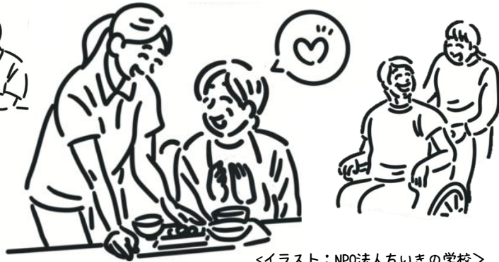
<イラスト：NPO法人ちいきの学校>