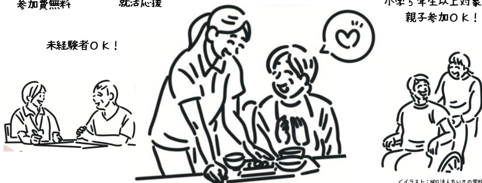
＜イラスト：NPO法人ちいきの学校＞