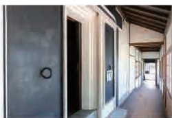
主屋の背面から渡り廊下でつながる土蔵の衣裳蔵