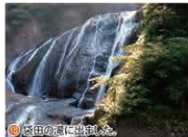
② 袋田の滝に出迎える。