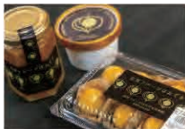
清流の郷・花買物産センターの花買フルーツはおずき、ジャムやアイスも評判