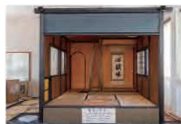
水引を特殊技術で編み上げた畳表が目を引き「黄金の茶室」