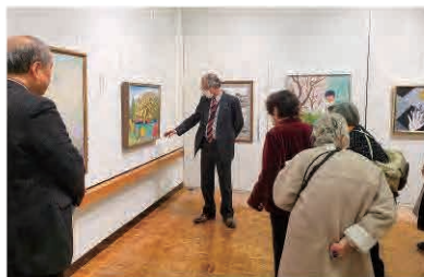
第28回美術展ギャラリートークの様子