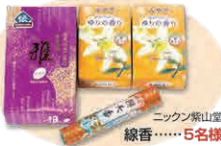
ニッポン紫山堂 線香……5名様

★締め切りは令和6年10月31日(消印有効)です。当選者については市町村名と苗字のみを次号に掲載し発表とさせていただきます。