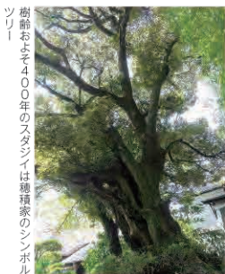
樹齢およそ400年のスタジイは穂積家のシンボルツリー