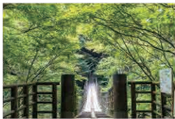
四季折々の移ろいを感じられる汐見滝の吊り橋は花貫溪谷随一の絶景スポット