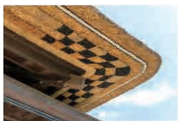
豪華な装飾が施された五段茅葺中竹節揃角市松模様寄構造