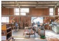
国産の木材で木工製品を手がけるたなつる工房

水戸徳川家の放牧場だった名馬里ヶ淵は、竜の姿に似た気味悪い子馬を淵に沈めた夜、大洪水が襲って村が跡形もなく流され、子馬の祟りと噂されたのだとか。花買駐車場近くの不動滝は、入れ食い状態で釣りを満喫していた男が蜘蛛のまやかしに遭い、危うく滝底の底に引きずり込まれそうになったという奇妙な逸話や河童に関する伝説が数多く残っています。