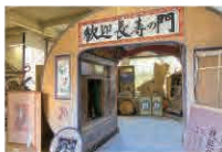
1階入口では延年転巻を込めた「長寿の門」が来場者を歓迎

す。昭和46年の開校以来、約350人の卒業生を輩出。水戸市の偕楽園や弘道館のほか、鳥根県の出雲大社、広島県の厳島神社など重要文化財、歴史的建造物、神社仏