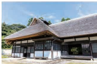
120坪の面積を有する穂積家の主屋