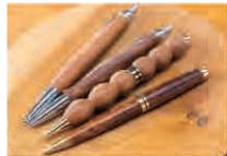
一つとして同じものができない木製ボールペン。手に馴染む形に削ってみましょう