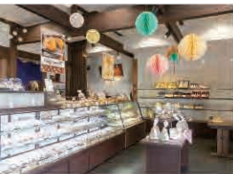
銘菓・八千代おこしで知られる創業111年の永寿堂