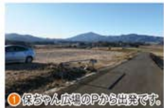
① 保ちゃん広場のPから出発です。