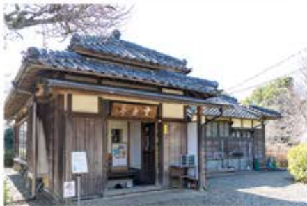
住井すゑ文学館からすぐ近くの小川芋銭記念館雲魚亭