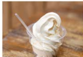
「みそソフトクリーム」は試してみる価値あり!

100年以上使用している杉の木桶で造る味噌は、すべての味噌に麴がたっぷり入っているので、自然な甘みの強い味噌に仕上がっています。熟成具合によって味も変化し、現在製造している味噌の種類は約20種類ほど。熟成がしっかりしている「赤みそ」が人気です。店頭には、麦や黒豆を使用した味噌もあり、深い甘みとコクがあつて上品な味の味噌汁が作れます。味噌づくり体験も行っており、5kg分の味噌を仕込み、その日に家に持ち帰って発酵させます。家で発酵具合がみられるのも魅力です。味噌を使ったスイーツなども販売しており、なかでも「みそソフトクリーム」は甘さとしょっぱさの絶妙なバランスが後を引く大人気商品です。旅の散歩で歩き疲れたら、休憩がてらに立ち寄って、牛久のお土産を麴たっぷりの味噌にしてみましたいかがでしょう。