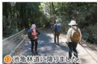
⑧ 池亀林道に降りました。