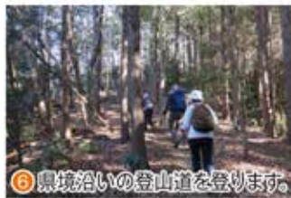
⑥ 県境沿いの登山道を登ります。