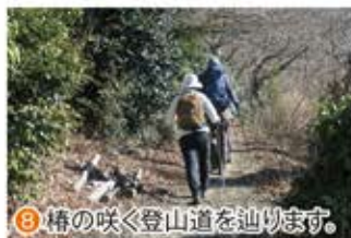
⑧ 椿の咲く登山道を辿ります。