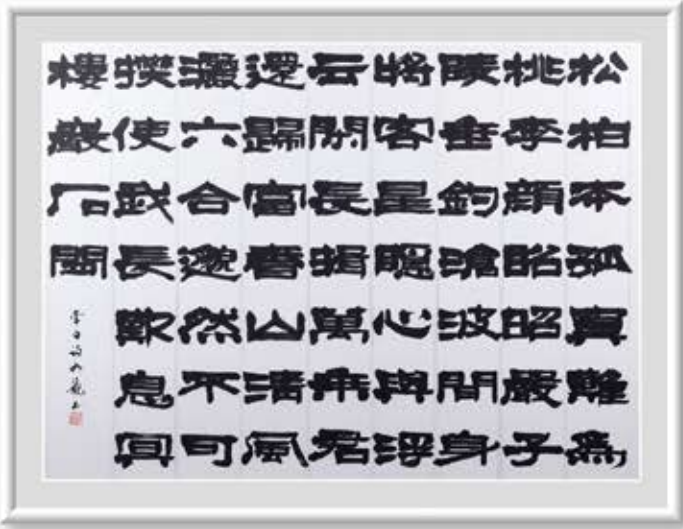
●書● 矢田部 如龍 水戸市 【題名】李白詩