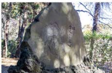
芋銭記念館の周辺には「河童の碑」など散策スポットが