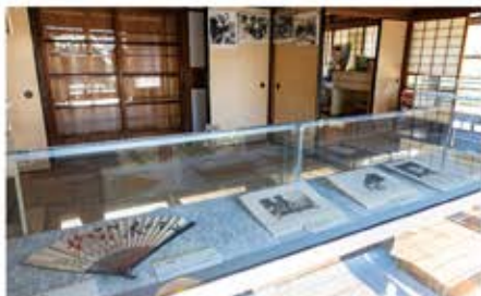
河童の絵で有名な芋銭の資料を見ることができます