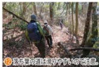
⑩ 落ち葉の道は滑りやすいので注意。