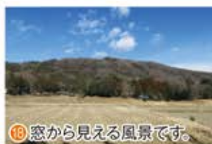
18 窓から見える風景です。