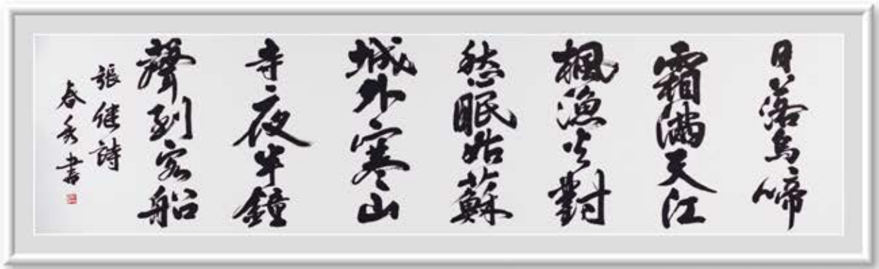
●書● 石井 春秀 日立市 【題名】張繼詩