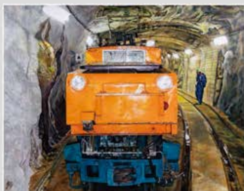
● 洋画 ● 大嶋 静 古河市 【題名】黒部の電気機関車