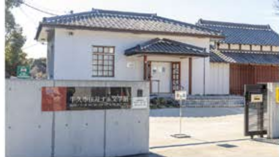
牛久市住井すゑ文学館。正面に見える建物は抱撲舎