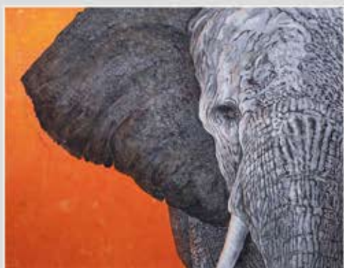
● 日本画 ● 北島 清子 結城市 【題名】若象