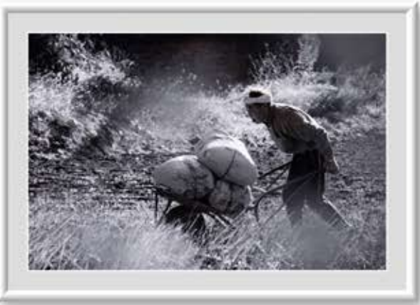
【題名】里山に生る