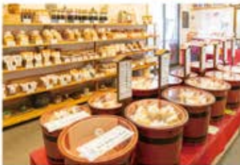
熟成具合によって味が変わる種類の豊富な味噌は全て試してみたくなるほど

味噌も造るようになったというこのお店は、地元産の大豆や米を材料として代々伝わる伝統の味噌づくりの技法を守りながら、現代に合った商品づくりをしています。