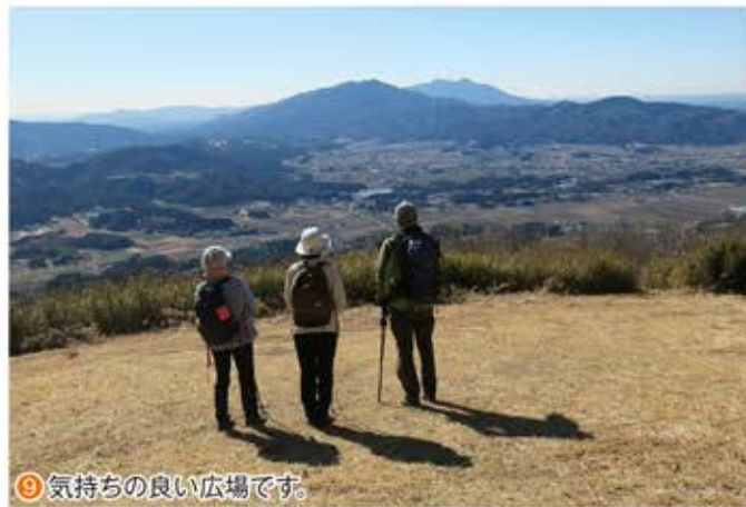
⑨ 気持ちの良い広場です。

平沢集落にある保ちゃん広場駐車場から高峯を目指します。歩いて直ぐに最初の絶景ポイント「高峯見晴デッキ」があります。ここからの眺めを楽しんでから林道平沢線を進みます。少し登ると「いだら坊の背負い石」と伝えられる伝説が残る巨大な石が林道脇にあります。更に15分ほど辿ると第一展望台に着きます。展望台からは筑波山を始め筑波連山の山々が眺められます。林道沿いから見える山桜を見ながら更に20分ほどで峠に出ます。右手に少し登ると展望デッキにベンチなどがある第二展望台の「平沢高峯展望台」に着きます。ここでも筑波山を始め筑波連山の山々が眺められます。また、春には下方に広がる山桜の織り成す景観が楽しめます。取材日には右手方向に富士山が良く見えました。 ここからは稜線上にある登山道を登ります。稜線上には登山道とは別にモトクロスバイクの道があり、並行又は交差しながら栃木県