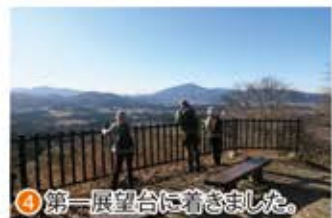
④ 第一展望台に着きました。