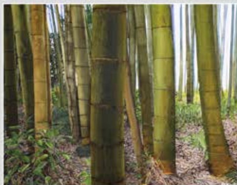
● 洋画 ● 後明 廣志 土浦市 【題名】竹林の妙