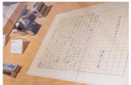
展示棟には手書き原稿や愛用品など貴重な資料が展示