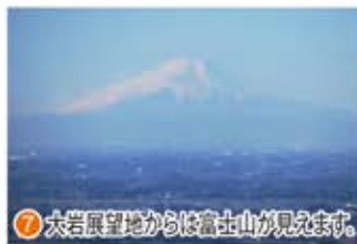
⑦ 大岩展望地からは富士山が見えます。