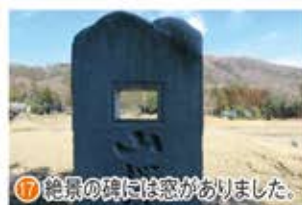
17 絶景の碑には窓がありました。