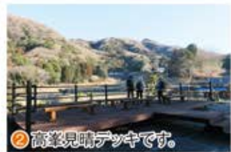
② 高峯見晴デッキです。