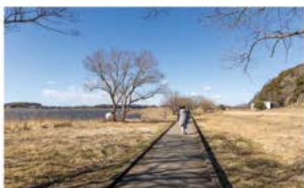
牛久沼沿いに整備されている「河童の小径」

生まれましたが、一家で牛久沼のほとりに移住し、以後、牛久に居を構え、数々の河童の作品を残しています。この雲魚亭は、小川芋銭が昭和13年に病に倒れ、その生涯を閉じる直前に建てられた、住まいを兼ねたアトリエです。遺族より市に寄贈され、現在は記念館として一般公開されています。中には、芋銭作品の複製の他、彼の遺愛品が展示してあり、彼がいかに河童を愛していたかが伝わってきます。どこかユーモラスで魅力的な河童たちの絵は、ファンが多いのも頷けます。