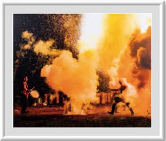
●写真● 石川 裕康 水戸市 【題名】すごい