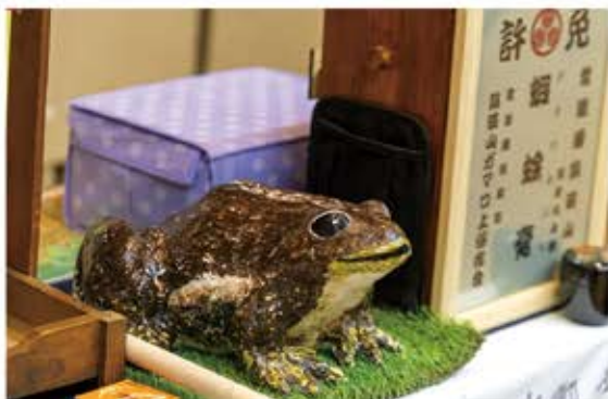
油売り口上は口上師ごとの個性も魅力。使用する小物にもオリジナリティが