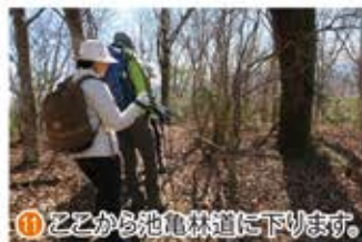
①① ここから池亀林道に下ります。