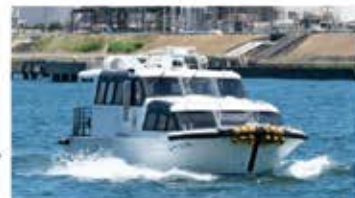
遊覧船ユーリカ号(座席数:36席/最大乗船人数:46名)

当社は、鹿島港を中心に大型船舶の安全な入出港をサポートする曳船事業や公共埠頭の管理運営、倉庫事業等を行っています。また、一般の方がより港に親しんでいただけるよう鹿島港内を一周する見学船を運航しており、停泊する巨大タンカーや大型クレーンの迫力ある荷役風景を海上から間近に見学できます。加えて、工場群の夕景と夜景が楽しめるクルーズの運航も予定しております。皆様のご乗船をお待ちしております。