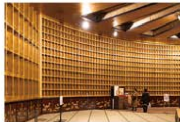
胎内3階「蓮華蔵世界」。約3400体の胎内仏に囲まれた金色の世界