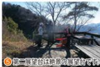
⑤ 第二展望台は絶景の展望台です。