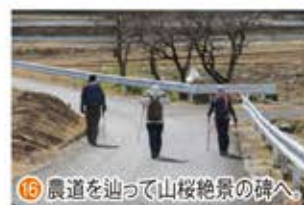
16 農道を辿って山桜絶景の碑へ。