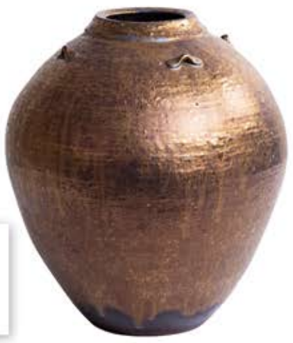
●工芸● 坂谷内 悟 取手市 【題名】金彩釉 四耳壺