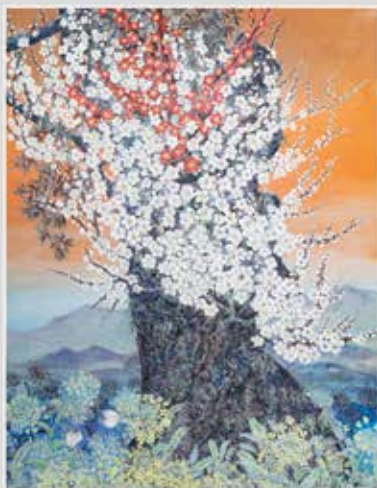
● 日本画 ● 堤 節子 筑西市 【題名】暖春