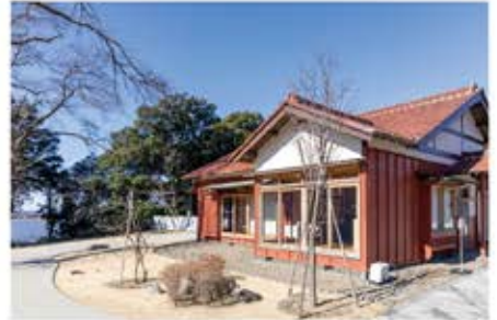
展示棟。奥には牛久沼を眺めることができるベンチが