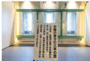
胎内4・5階「雲霧山(りょうじゆせん)の間」。窓から眺望を楽しめます

なっています。高さは120メートル、総重量4000トンという巨大なこの仏像は、青銅製仏像としては世界一の高さを誇ります。その大きさを誇るや、奈良の大仏が