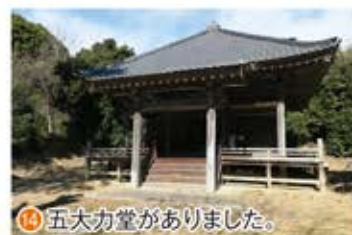
14 五大力堂がありました。