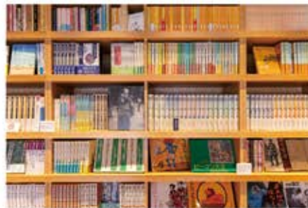
保管されていた蔵書コレクション