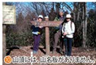
⑪ 山頂には、山名板がありません。