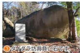
③ タイダラ坊背負い石です。